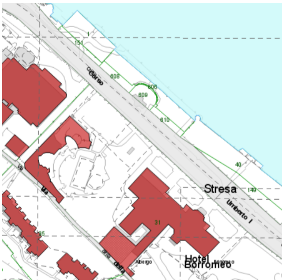
Estratto mappa e aereofotogrammetrico Foglio 13 mapp. 609

https://www.comune.stresa.vb.it/it-it/amministrazione-trasparente/opere-pubbliche/atti-di-programmazione-delle-opere-pubbliche